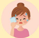
熱中症による健康被害