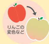
りんごの変色など