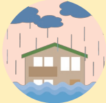
大都市の洪水・豪雨