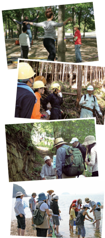
GREEN DAYS COLLEGEでは、森林間伐体験や自然観察会など24のプログラムが組まれた