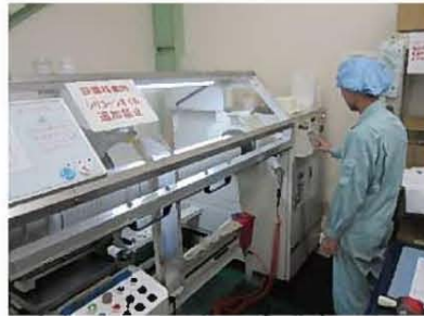
粘着テープのロールを裁断する際、角度調整などの改善を重ねることで幅精度が上がり、廃棄を削減。