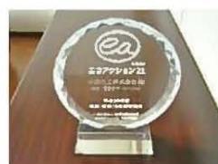
平成29年に認証・登録10年を迎え、事務局から表彰されました。

大規模な設備投資やシステムの新規構築といった負担を増やすことなく始められます。また、審査員が助言・提案とともに参考になる他団体の事例も教えてくれるので、改善策に行き詰まることなく取り組みを継続しやすい活動です。