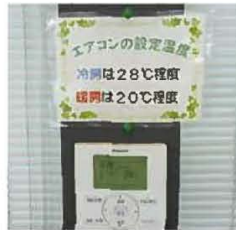
エアコンの設定温度掲示。シンプルな取組みですが、周知と習慣づけには最も効果的な方法です。

※かつては目標値と実績を記録していましたが、審査員の指導で平成24年から単位売上当たりの数値を算出。取組みの効果が分かりやすくなりました。