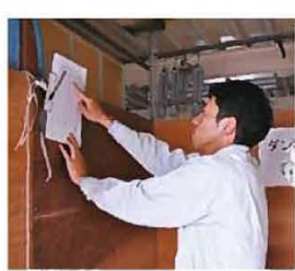
古紙回収業者が記入した回収量をチェックすることで、日々の排出量を把握しています。

「これからEA21の取組みを始める企業へメッセージを。」 中小企業では、環境活動に専任の部門を設けることは困難。EA21はできることから取り組める点が魅力です。当社は削減目標を前年度比の1%減に設定しています。が、徐々に結果が出ています。ぜひ他企業のみなさまにも取り組んでほしいです。