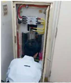
計測器をとりつけて、系統別の電気使用量を調査しました。