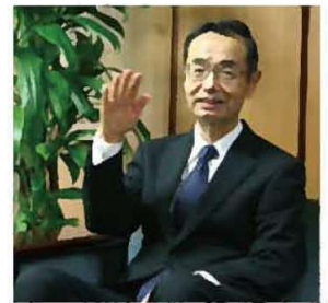
「E A21の取り組みが企業の競争力アップに繋がります。」

—ISOからエコアクション21に 切り替えたきっかけは？ ISOは意義のある環境経営シ ステムですが、規格の要求事項が 多く厳格な面も。また、国際基準で あるため、国内や地方で活動する 中小企業にとっては負担になるこ ともあります。2015年から当 団が地域事務局を務めているエコ アクション21(以下E A21)は、環 境省が作成したガイドラインで、 中小企業でも取り組みやすい内容。 要求事項に沿って計画・実行・評価・ 改善をする流れはISOと同じで、 成果が縮小するということもあり ません。岡山県内で活動する当団 としてはE A21のほうが相応だと 考え、ISO2015年版への移 行を前に切り替えを決めました。