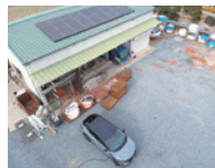
太陽光発電で得た電力は、事務所の照明や冷暖房などに利用。EV車両の充電にも活用しています。