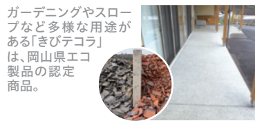
ガーデニングやスロープなど多様な用途がある「きびテコラ」は、岡山県エコ製品の認定商品。